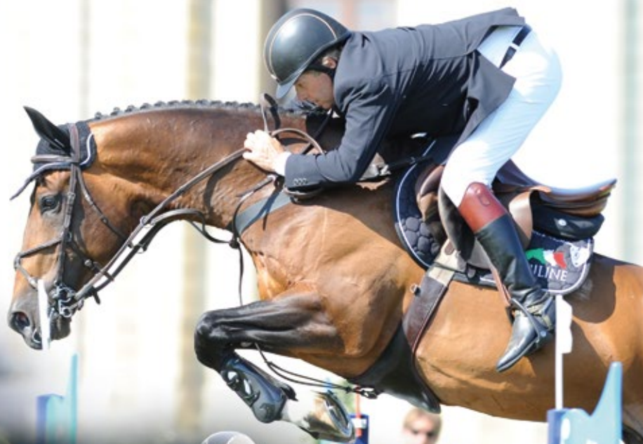
NICK SKELTON (GBR)